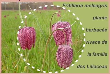
"toucher des yeux"

La fleur s'épanouit dans les prairies humides de fin mars à mai. Sa couleur panachée est à l'origine de son nom : fritillaire "pintade", en référence au plumage de l'oiseau. Dans l'ouest de la France, les fritillaires sont aussi appelées Goganes.