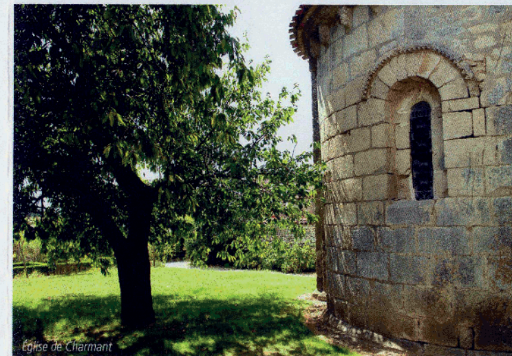
Eglise de Charmant