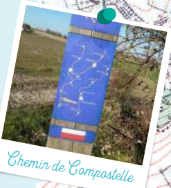
Chemin de Compostelle