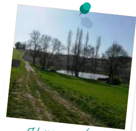
Vallée de l'Écly

Là, prendre la route à gauche et tourner aussitôt à gauche entre deux parcelles de vignes. Au bout tourner à droite et continuer tout droit vers le sommet de côte. Redescendre vers l'étang.